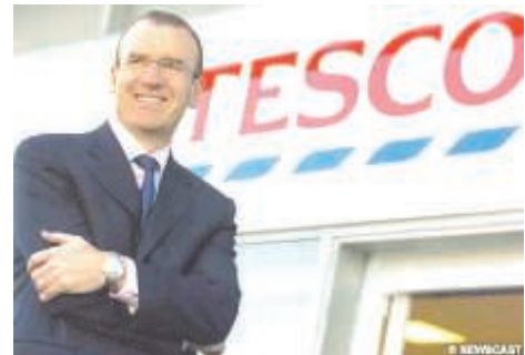
ТЕРИ ЛЕАХ власник ланца “Tesco”

Посао са којим сте се винули у бизнис можда неће бити онај са којим ћете завршити. Али морате се држати основне сврхе зашто сте кренули у њега. То је један од разлога зашто породични бизниси трају дуже од јавних! Они боље и снажније штите свој основни циљ!