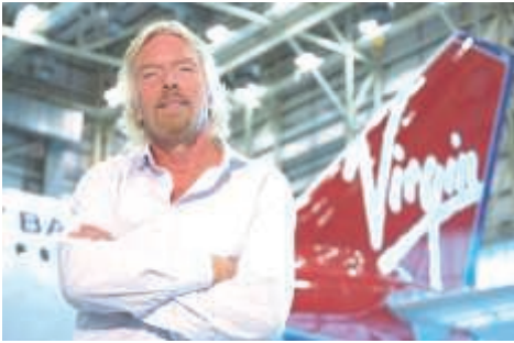
РИЧАРД БРЕНСОН власник компаније “Virgin Group”

Важна ствар за оснивање бизниса је умјетност одабира. Пронађите људе који су бољи у одређеном послу од вас, да раде тај посао за вас. Искочите у страну што чешће можете, како би сагледали све из друге перспективе.